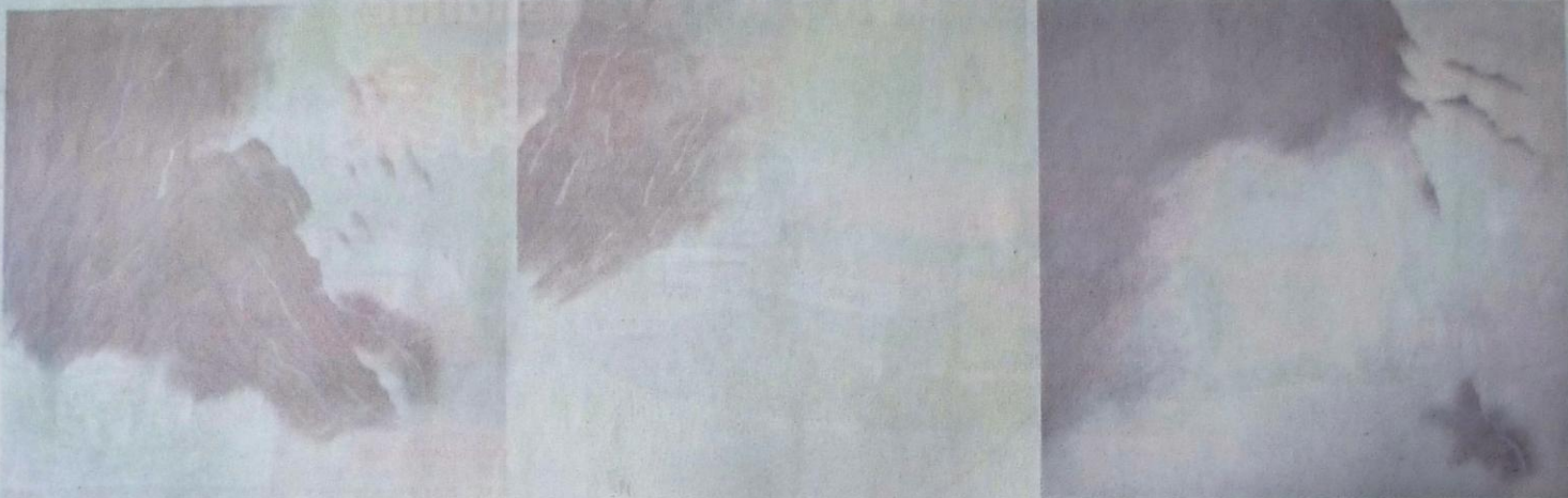
(左起)《悠然#2》、《悠然#3》、《悠然#4》 2014年作品，布上水墨丙烯，各122×122cm

杜之外的《悠然》系列共有28張作品，有遠景有近景，都在這兩年間創作。白霧是亞加力油彩，薄薄一層一層的塗上，直至已畫好的山脈朦朧一片，再加深全掩蓋白霧的位置。於展覽中，悠然#2、#3、#4並排掛牆，雖不是連幅，但三張一起看，便有一種難言的寧靜及自由自在感。